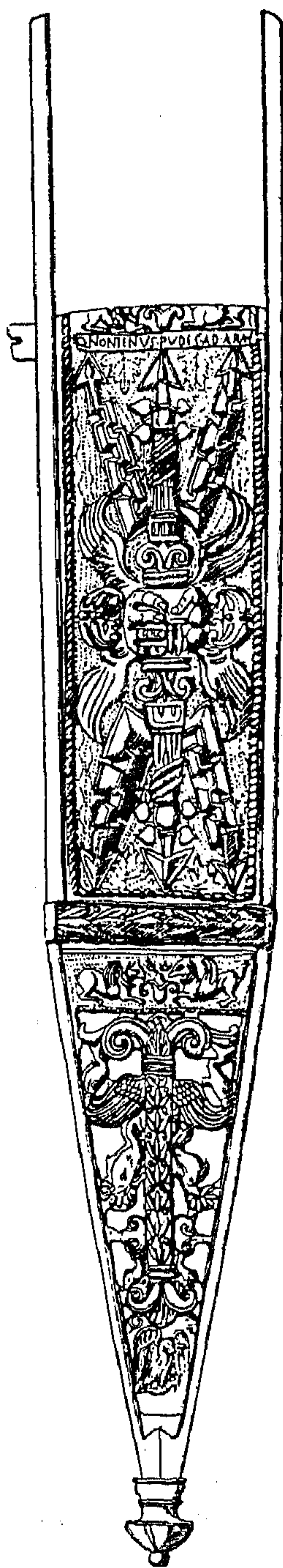
Afb. 3. Straatsburg, 1904. Zwaardschede, versierd met vergulde platen van bronsblik. Schaal 1 : 3. Naar Ulbert 1971 (noot 10), 47, Abb. 2, 2.

speerpunten van deze laatste zijn aan de onderkant versierd met twee stengels die elk twee klimopbladeren hebben, waarmee ze naar het schijnt vastgebonden zijn aan de bijbehorende schachten.