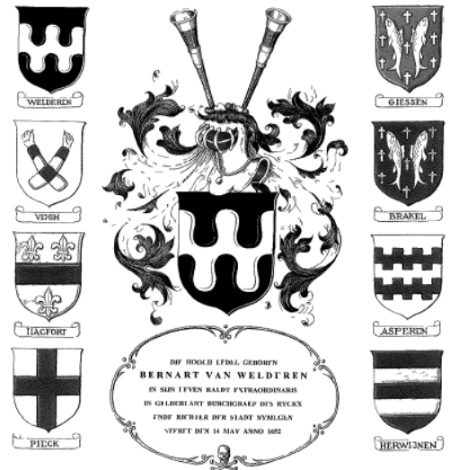
Reconstructie van het rouwbord van Burggraaf Van Welderen [†1652] (nr 54) door J B Bronsema

N.A. Hamers, Rouwborden in de St. Stevenskerk 1632-1660 (Zoeklicht 2000 genealogische heraldische bundel 251-258 (Regionaal Archief Nijmegen A 527 / 4