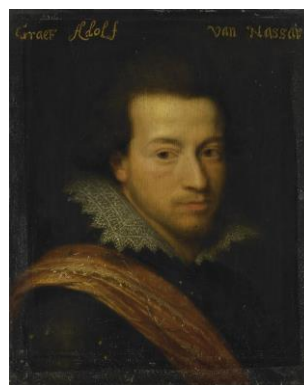
Toegeschreven aan Jan Antonisz. van Ravesteyn (ca. 1572-1657) (Rijksmuseum, Amsterdam)