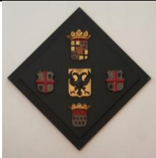
Wapenbord waarop twee maal het wapen van Singendonck (Stevenskerk, Nijmegen)