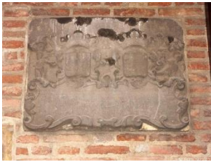
Deze gedenksteen werd in 1745 geplaatst in de muren van de Kraan aan de Waalkade en herinnert aan de hoge rivierwaterstand van 1740. Bovenaan staan de wapens van de burgemeesters Dirck Singendonck en Johannes Swaen.

In 1880 werd besloten om de gevelstenen, die afkomstig waren van de gesloopte stadspoorten en –muren, een plaats te geven op de Gedeputeerdenplaats van het stadhuis. Ze werden in de westmuur van het binnenplaatsje ingemetseld.