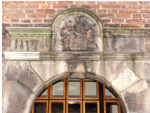
De bovenzijde van het poortje uit 1643 met de wapens van het echtpaar Van Singendonck-Romswinkel. Het poortje komt uit een afgebroken pand aan de Snijderstraat 23 en werd tijdens de naoorlogse restauratie van het stadhuis hier geplaatst.