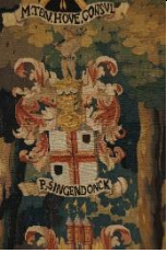
Wandkleed met wapen van P. Singendonck in stadhuis Nijmegen (zie ook 360 en 408 )